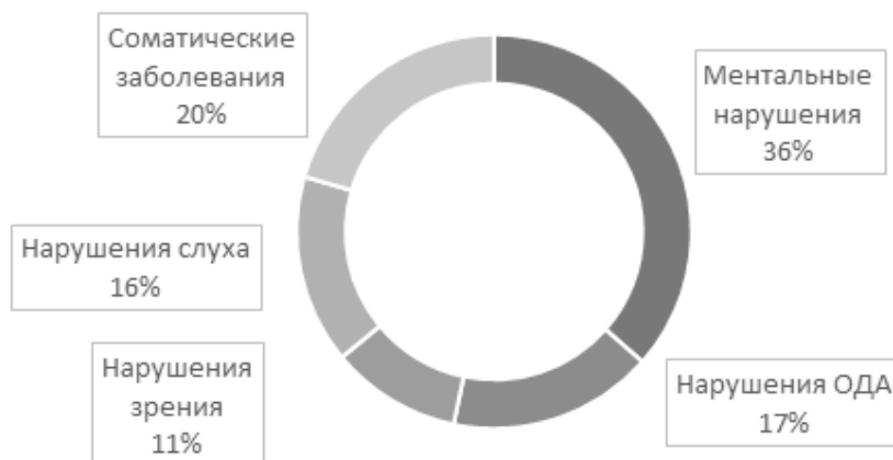
Рис. 1. Распределение участников конкурсов «Абилимпикс» 2019 г. по группам нозологий